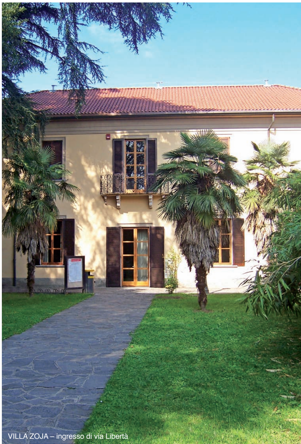
VILLA ZOJA – ingresso di via Libertà