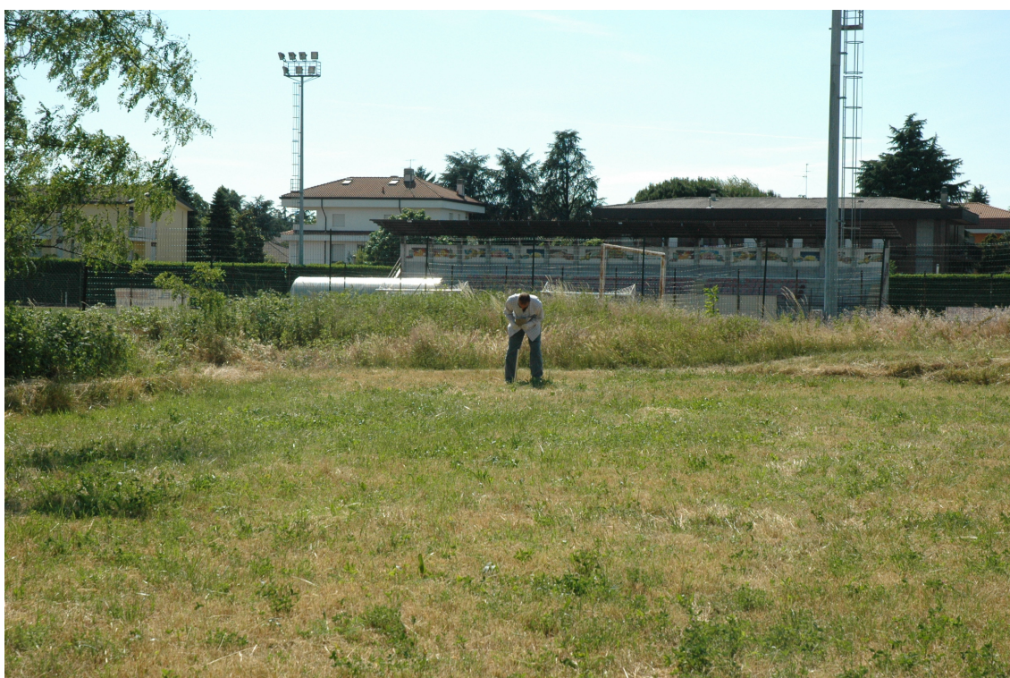
Fotografia 4: Posizione MASW 3