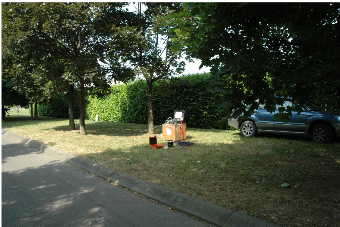
Fotografia 5: Posizione MASW 4