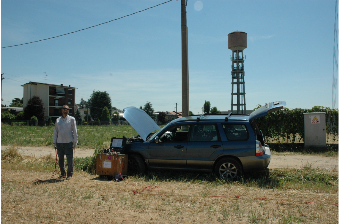
Fotografia 11: Posizione MASW 10