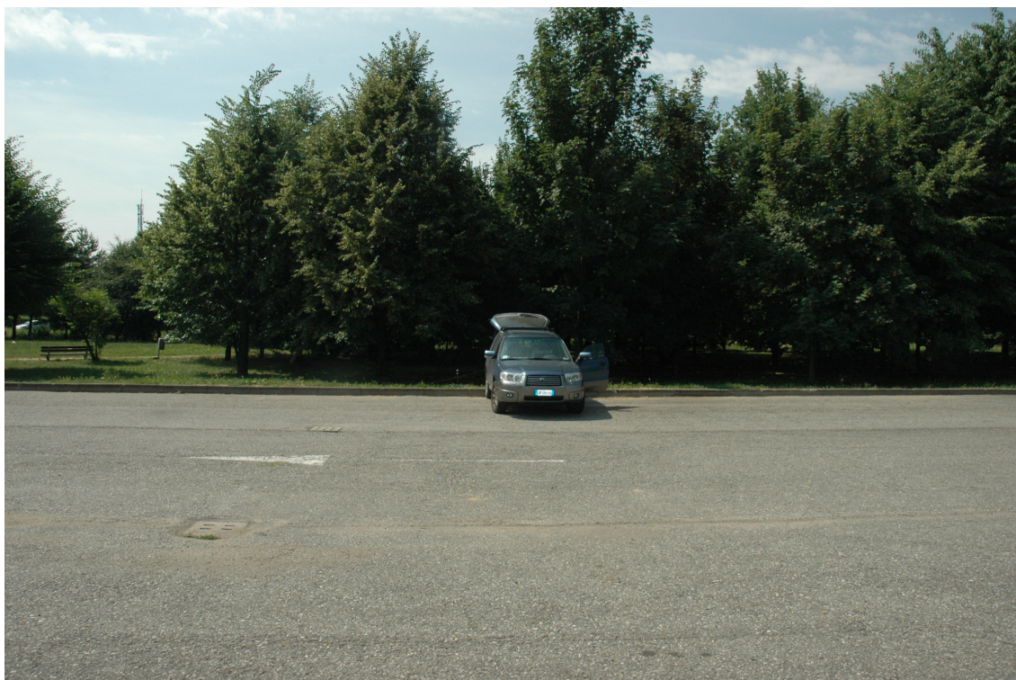
Fotografia 3: Posizione MASW 2