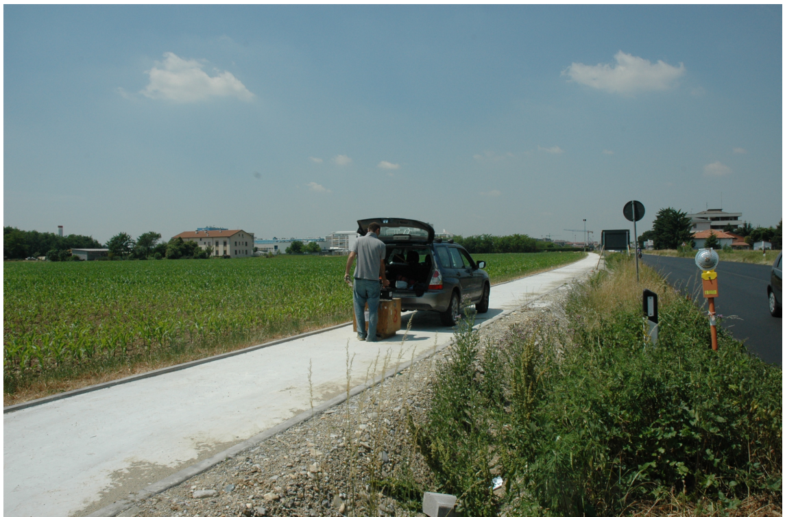
Fotografia 2: Posizione MASW 1