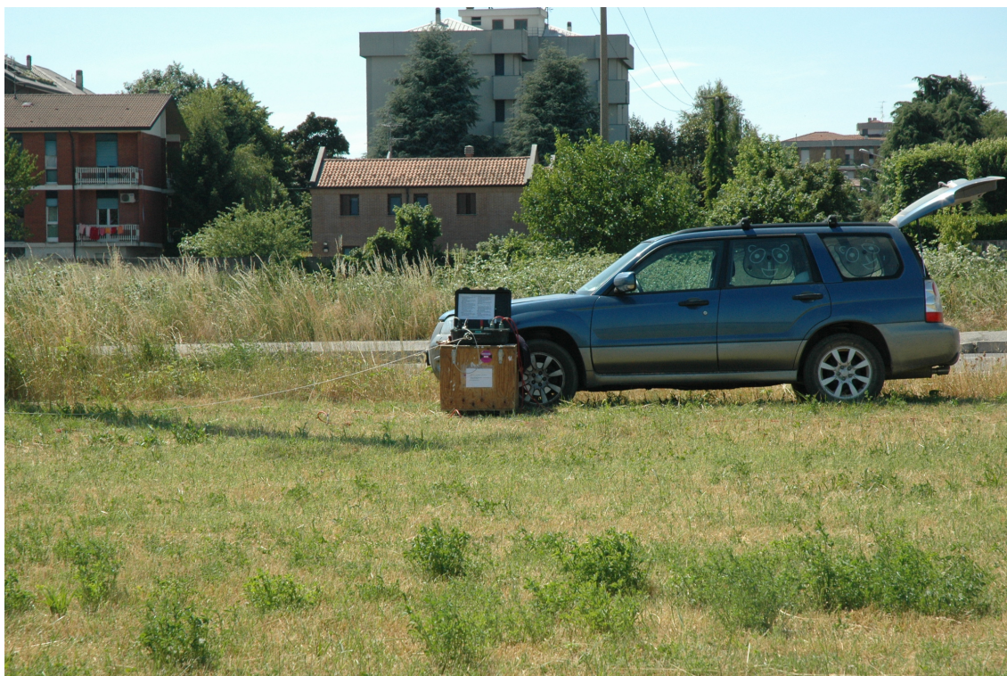
Fotografia 8: Posizione MASW 7