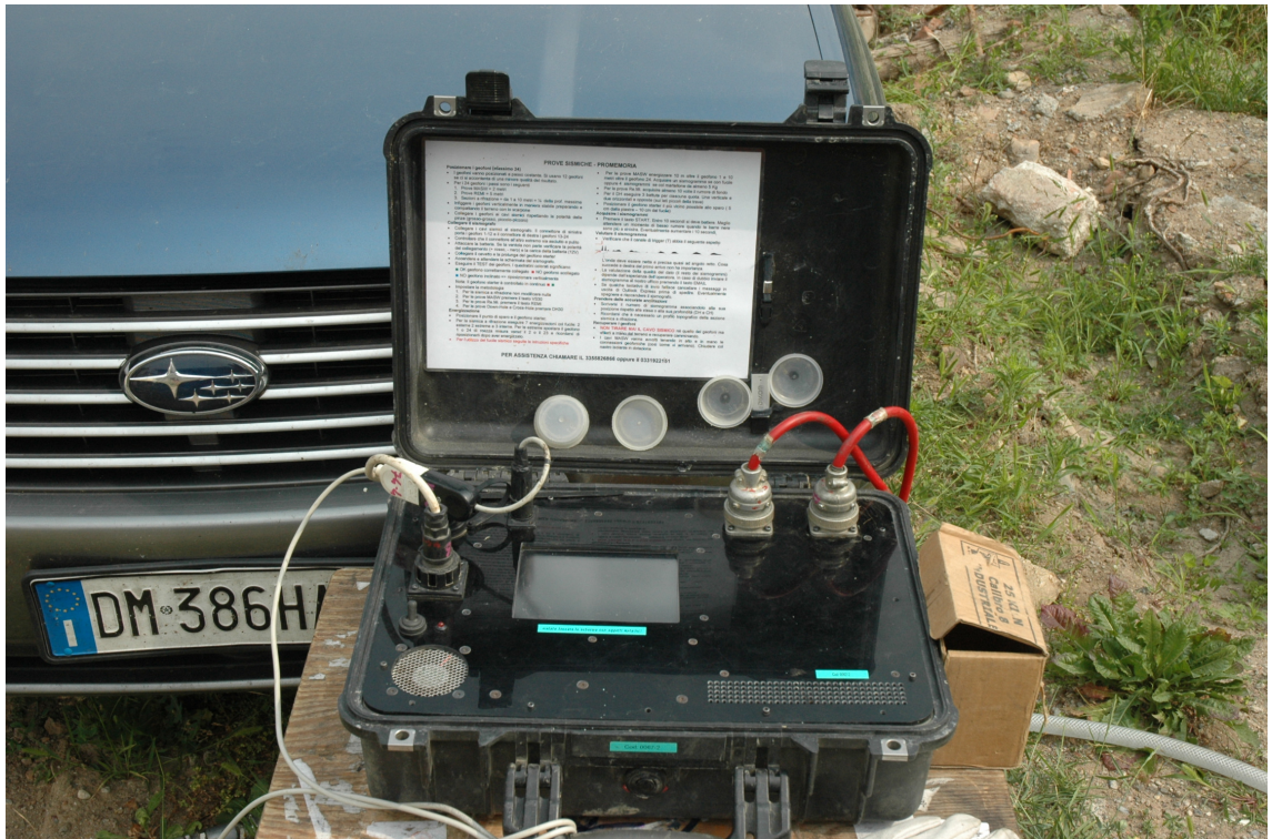
Fotografia 1: Acquisitore onde sismiche