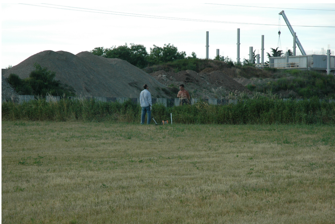
Fotografia 6: Posizione MASW 5