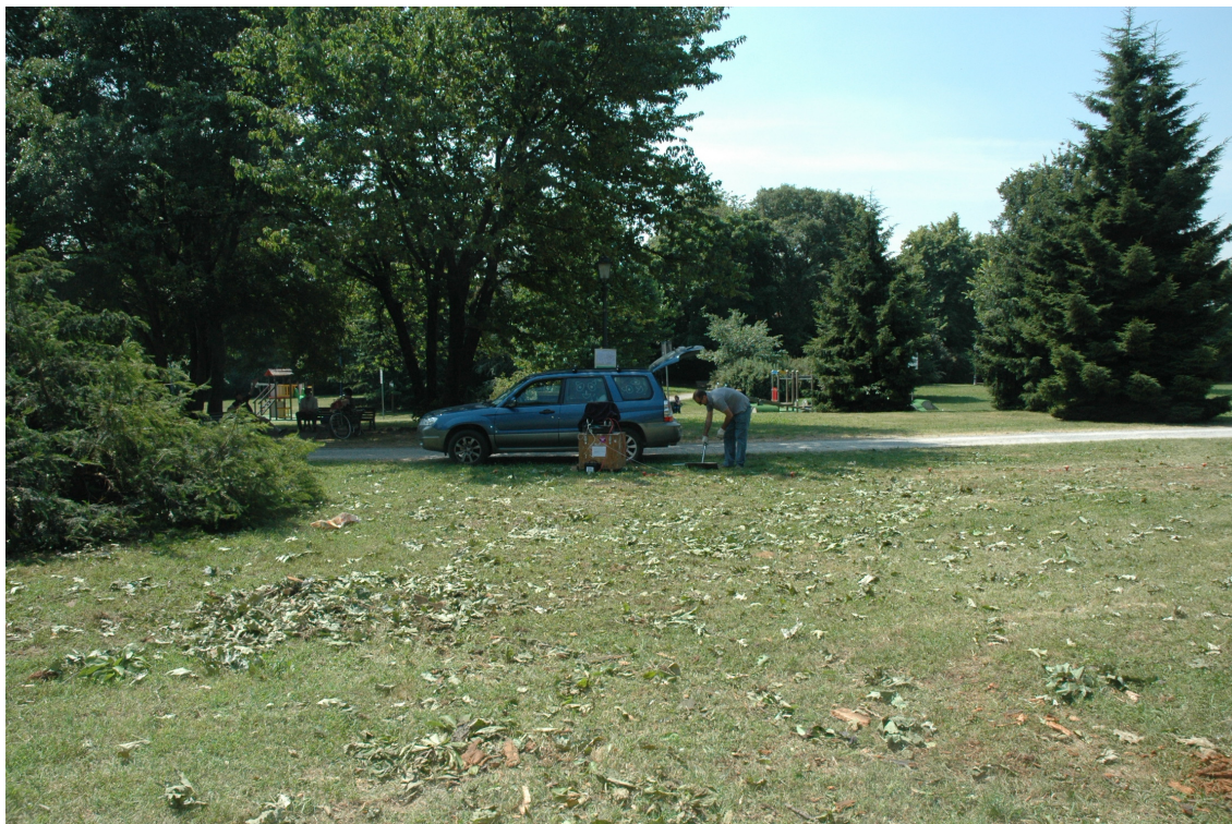
Fotografia 7: Posizione MASW 6