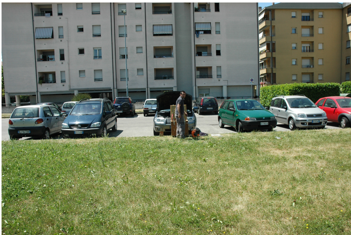
Fotografia 9: Posizione MASW 8