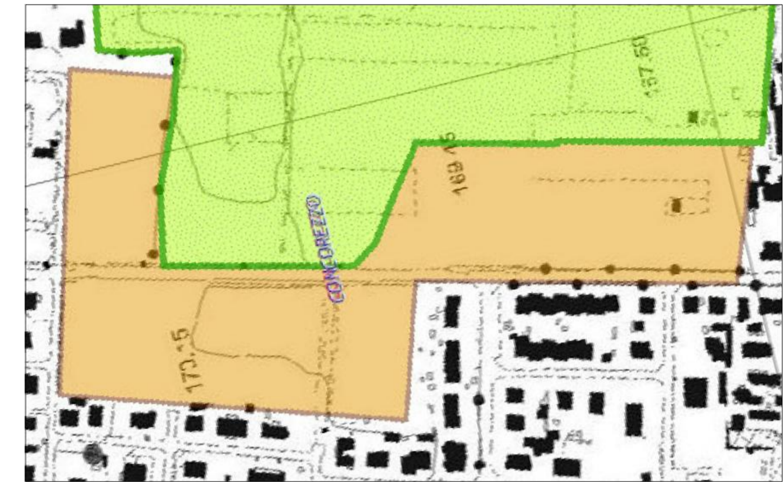
STRALCIO DELLA TAVOLA 6d DEL PTCP "AMBITI DI INTERESSE PROVINCIALE"