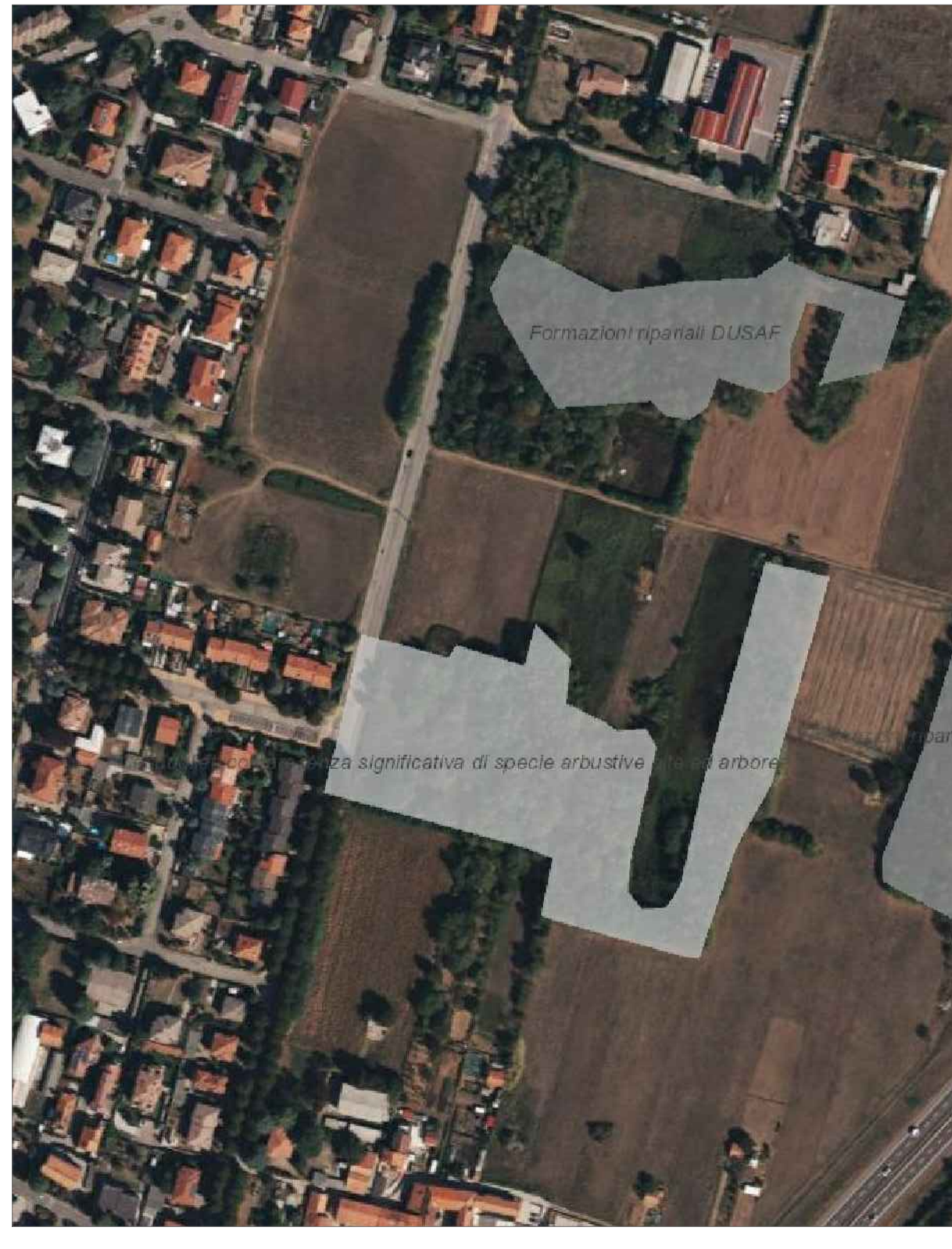
STRALCIO CARTA FORESTALE (PERIMETRO DEL BOSCO) REGIONE LOMBARDIA